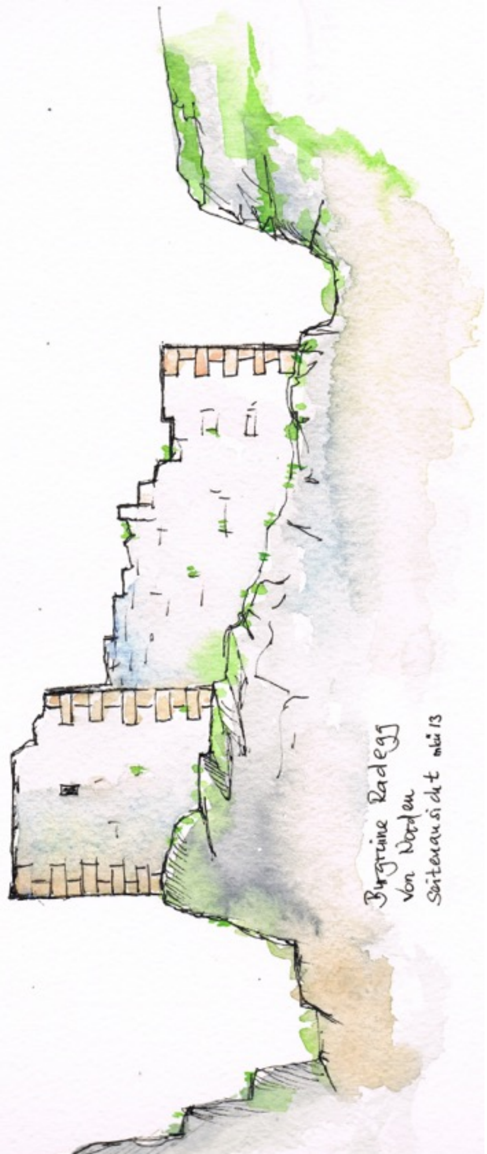
Burgine Radegg von Norden Seitenaussicht m.13