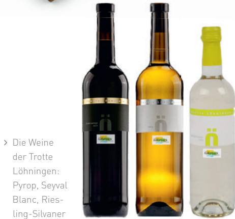
> Die Weine der Trotte Löhningen: Pyrop, Seyval Blanc, Riesling-Silvaner