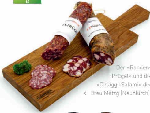
Der «Randen-Prügel» und die «Chläggi-Salami» der Breu Metzg (Neunkirch).